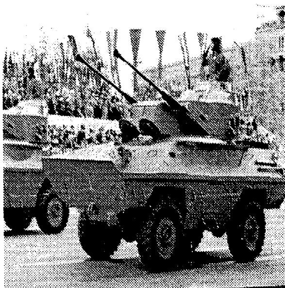
Afbeelding 1; BOV-30 LUA