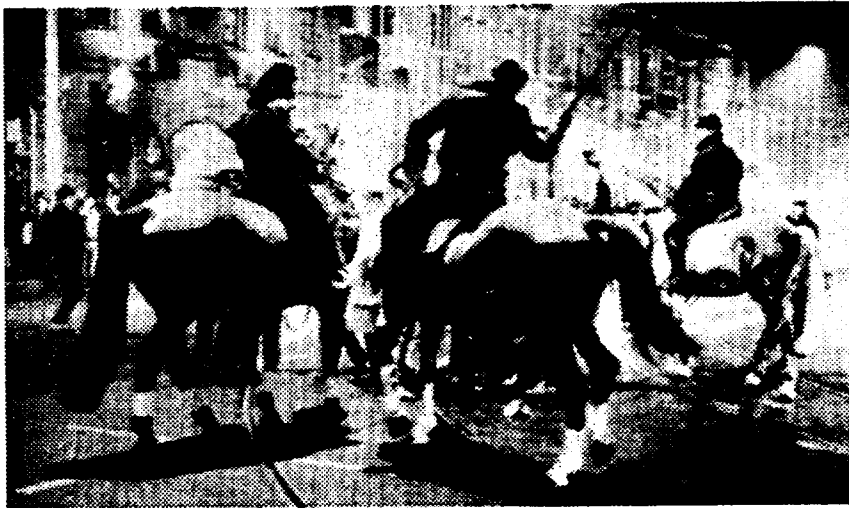
Anti-oorlogsdemonstratie Amsterdam 19 januari

In de editie van "NN" van 24 januari werd de aandacht verplaatst van de militaire transporten naar het militair industrieel complex in het algemeen. Het blad publiceerde onder de in kapitale letters gezette leuze "SABOTEER DE OORLOG", een opsomming van tientallen bedrijven die, volgens het Anti-Militaristies Onderzoeks Kollektief (AMOK), produkten met een militaire toepassing aan Irak hebben geleverd of betrokken zijn bij het transport van militair materieel naar het Golfgebied. Mogelijk naar aanleiding van deze expliciete opwekking voerden acht vermomde activisten enkele dagen later een vernielingsactie uit in het voorlichtingscentrum van het ministerie van Defensie.