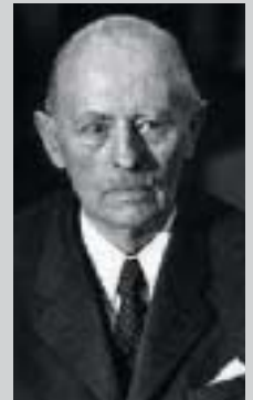
Gehlen op latere leeftijd

Der Dienst heet de autobiografie van Reinhard Gehlen, de oprichter van de Bundesnachrichtendienst (BND) en dit interessante boek mag met recht als klassieker worden aangeduid vanwege de lering die we eruit kunnen trekken.