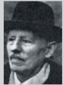
Gehlen in zijn tijd bij de Fremde Heere Ost