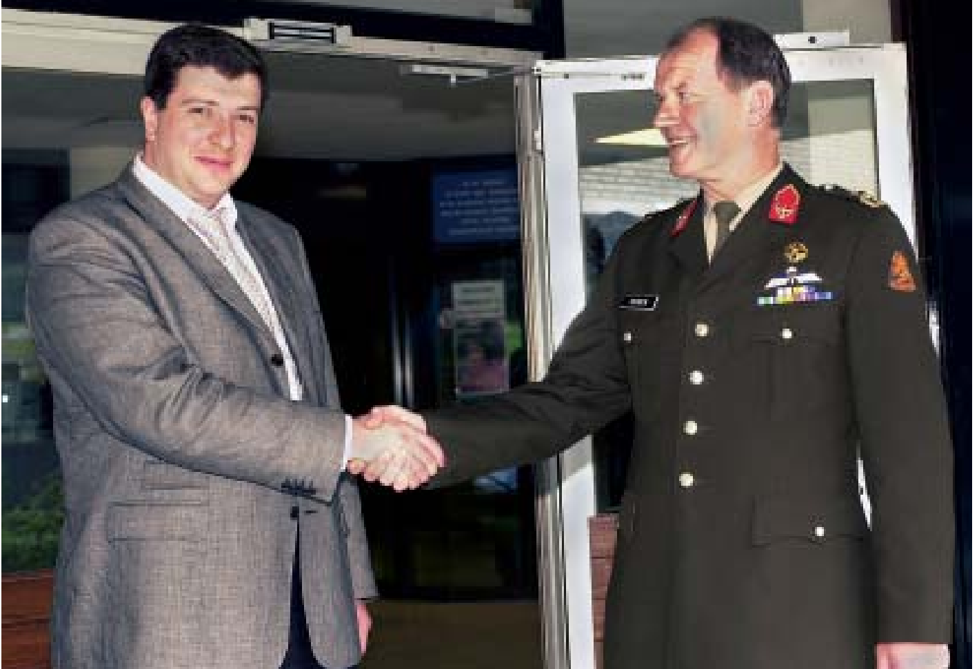
Staatssecretaris Ugulava wordt uitgeleide gedaan door generaal-majoor Dedden