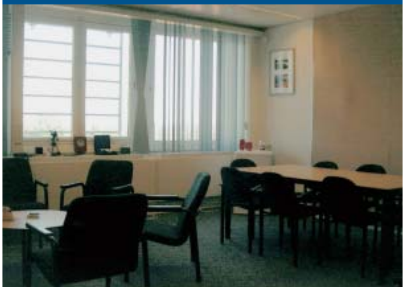
Vriendelijker, comfortabeler, veiliger

"Kijk, of het resultaat van het ontvangen van bezoekers in zo'n 'aangeklede' ruimte nu veel groter is dan voorheen, weet je niet, dat is niet meetbaar. Maar je mag er toch van uitgaan dat het in elk geval wat helpt. Belangrijkste is dat we nu kleine delegaties of individuele bezoekers op een representatieve wijze kunnen ontvangen. Dit is vriendelijker, comfortabeler en veiliger."●